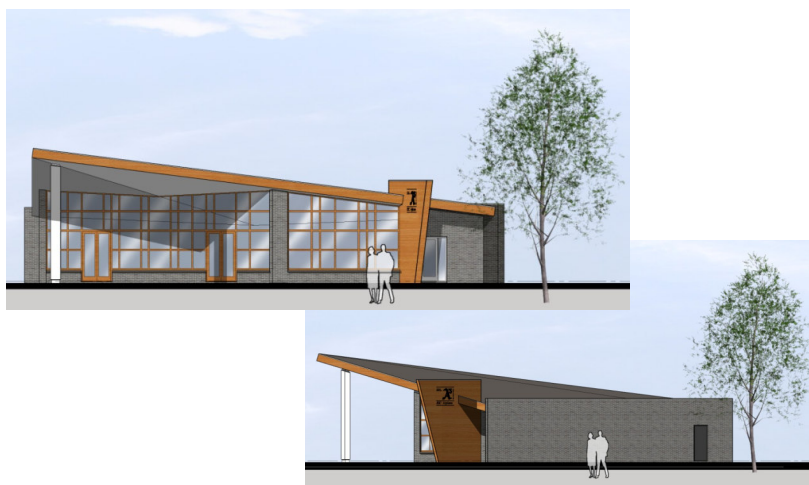
Een impressie van de nieuwe kantine.

Er is op alle velden een sproei-installatie aangebracht.